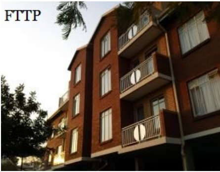
Formation à temps plein à Pretoria en Afrique du Sud