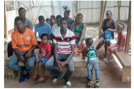
Reunion des saints le 31 janvier 2021

Il s'agit du deuxième plus petit pays d'Afrique après les Seychelles avec une population d'environ 220 000 habitants. Ses ressources sont limitées, et son économie déjà fragile est devenue encore plus précaire avec la pandémie. Le nombre de saints qui continuent à se rassembler a diminué, mais ils continuent à louer le Seigneur en toutes choses et Le remercient pour Son appel. Nous prions pour une plus grande avance du Seigneur dans ce pays et dans cette région.